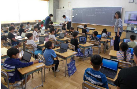
1年 初めてのクロームブック

◇初めてのが続きます。今日は、クロームブックに挑戦です。とはいえ、普段スマホやタブレットを使っているのか手慣れた様子でした。上達が早そうです。