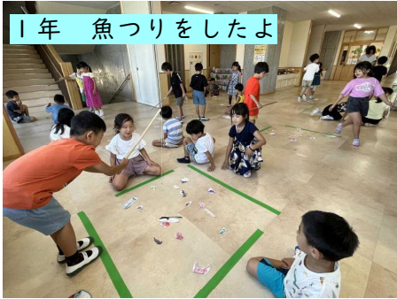
1年 魚つりをしたよ

◇図工の時間に作った「海のいきもの」を使ってみんなで魚つりをしました。みんなの手作りの作品で遊ぶ1年生の顔は満面の笑みでした。