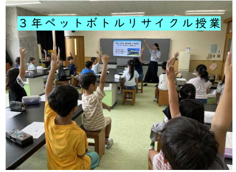
3年 ペットボトルリサイクル授業

◇サントリーから講師の先生をお迎えしペットボトルリサイクルについて学びました。合い言葉は「ボトル to ボトル」です。今後がんばります!