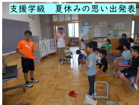
支援学級 夏休みの思い出発表

◇夏休みの思い出発表会を支援学級のお友だち全員で行いました。さすが高学年の発表!しかし低学年も負けずに素晴らしい発表を見せてくれました。