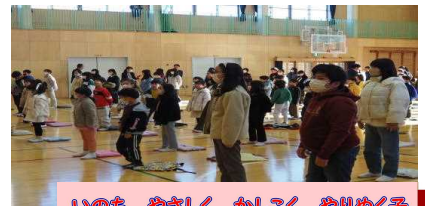
いのち やさしく かしこく やりぬく子

保護者の皆様、地域の皆様には、本年もこれまで同様、本校教育にご理解とご協力を賜りますようお願いいたします。