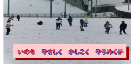
いのち やさしく かしこく やりぬく子

1月の寒中を経て、2月3日の節分、4日の立春と、暦の上では春になりましたが、まだまだ寒暖差が大きい日が続いています。甲府市も2月の初旬に大雪に見舞われました。一面真っ白になった校庭では子ども達が元気に雪遊びをする姿が見られましたが、テレビなどの映像を見ると、10年前、山梨を襲った記録的な大雪の記憶（悪夢のような）が呼び起こされました。しかし、昨日25日（日）に降った雪はあっという間に解けてしまいました。まさに、三寒四温を肌で感じるこの頃です。