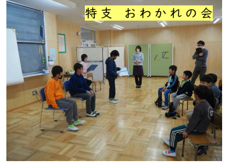
特支 おわかれの会

◇先生は知っていたのか知らなかったのか。4年生のフォルダを見ていて見つけました。先生の誕生日を祝ってのメッセージが黒板一面に!優しいですね。